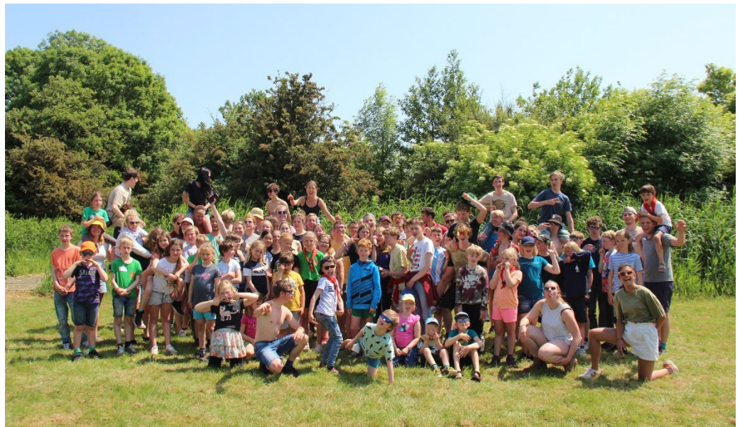
Groepsfoto tijdens Groepsweekend 2023

Daarnaast heeft de Groepsraad in 2023 afgesproken om het rookbeleid verder aan te scherpen en daarmee stappen te zetten richting een Rookvrije generatie.