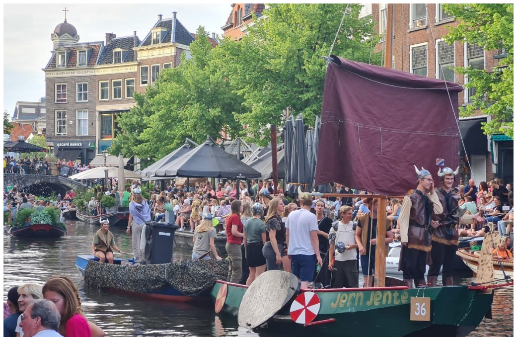
De Stam wordt tweede tijdens de Peurbakkentocht